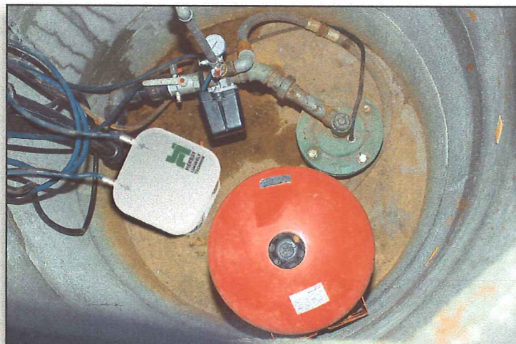
Hauswasserversorgung mit FerroSorp® Plus-Filter

Die Lösung bietet unser Spezialadsorbens FerroSorp® Plus. FerroSorp® Plus ist ein hoch reines eisenhydroxidhaltiges Granulat, mit dem sich die Arsenite und Arsenate aus dem Wasser abscheiden lassen. Dabei wird im ersten Schritt das Arsen an der FerroSorp®-Oberfläche adsorbiert. Im zweiten Schritt erfolgt die Reaktion zu einem stabilen Eisenarsenat. Des Weiteren werden Phosphate, Schwermetalle und Schwefelwasserstoff von FerroSorp® Plus adsorbiert.