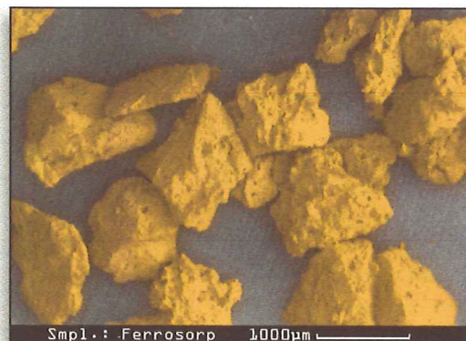
FerroSorp®-Partikel unter dem Rasterelektronenmikroskop